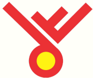
PT. WINA KARYA MULIA

PT. WINA KARYA MULIA Tergabung dalam ROJO SAFETY GROUP bersamaan dengan PT. TRIKARYA SINERGI MULIA dan Lembaga Pelatihan Kerja Karya Mulia (LPKKM)